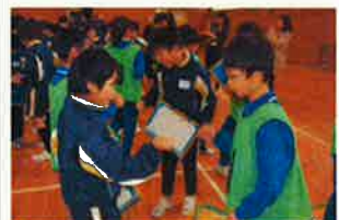
【仲間づくりゲーム】