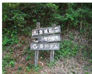
②案内板 (松倉城跡へ)