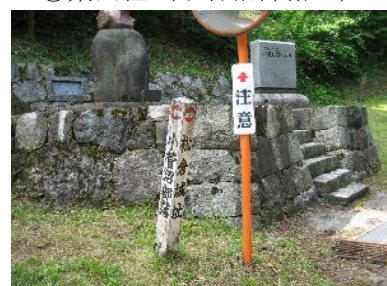
③案内柱 (小菅沼部落へ)