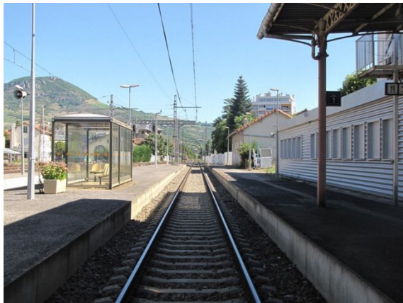
ミヨール駅 (フランス)