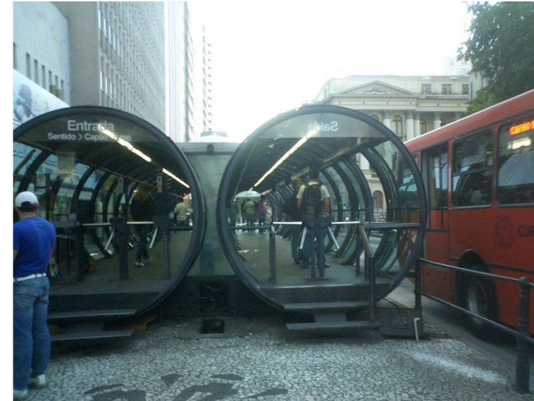
クリチバ（ブラジル）