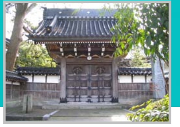
㉑ 照頭寺(青山佐渡守菩提寺)