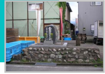
③ 八幡騒動犠牲者納経塚