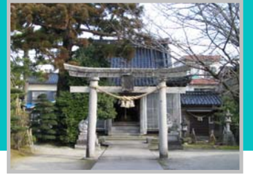
㉒ 金刀比羅宮(山伏寺)