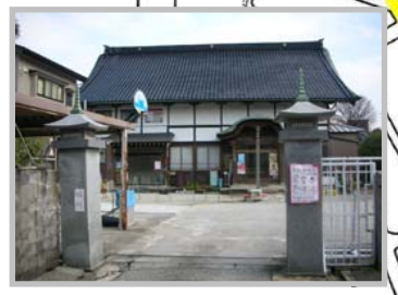
⑭ 華王寺(上杉軍諸将の塚)