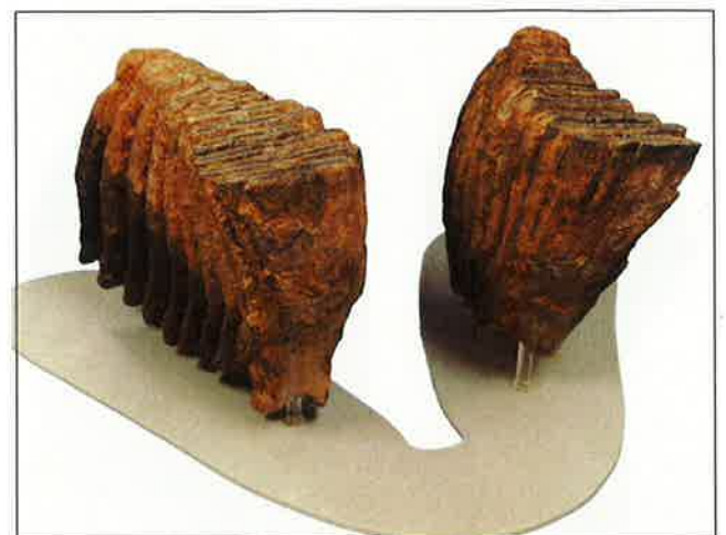
富山市長川原出土のナウマンゾウ臼歯(富山市科学博物館蔵)

国立科学博物館に所蔵されている祖山出土のナウマンゾウ化石も大臼歯であるが、その発見は江戸時代末期で、出土層などの詳細は不明である。この化石は1924年頃まで東京帝室博物館(現東京国立博物館)が所蔵していたが、後に国立科学博物館の前身である東京教育博物館に移管されている。発見から博物館に所蔵されるまでの経緯などは明らかでない。