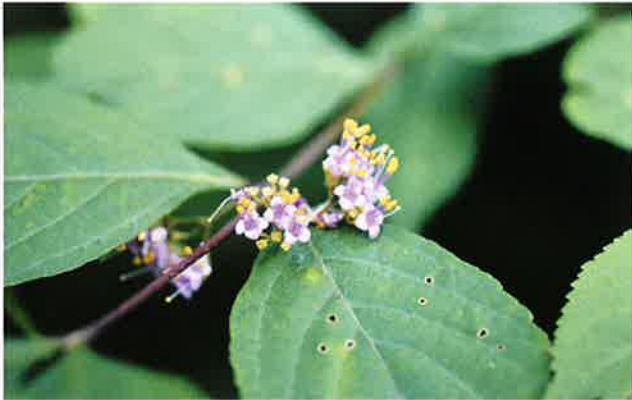
ムラサキシキブの花

およそ1000年前に書かれ、その後の日本文学に大きな影響を与えた超大作『源氏物語』。その作者の名をいただいたムラサキシキブは、秋に熟す果実が美しく人気の高い樹木です。色鮮やかな果実は鳥の目を引き、食べられることで遠くまで種子を運んでもらう意味があります。