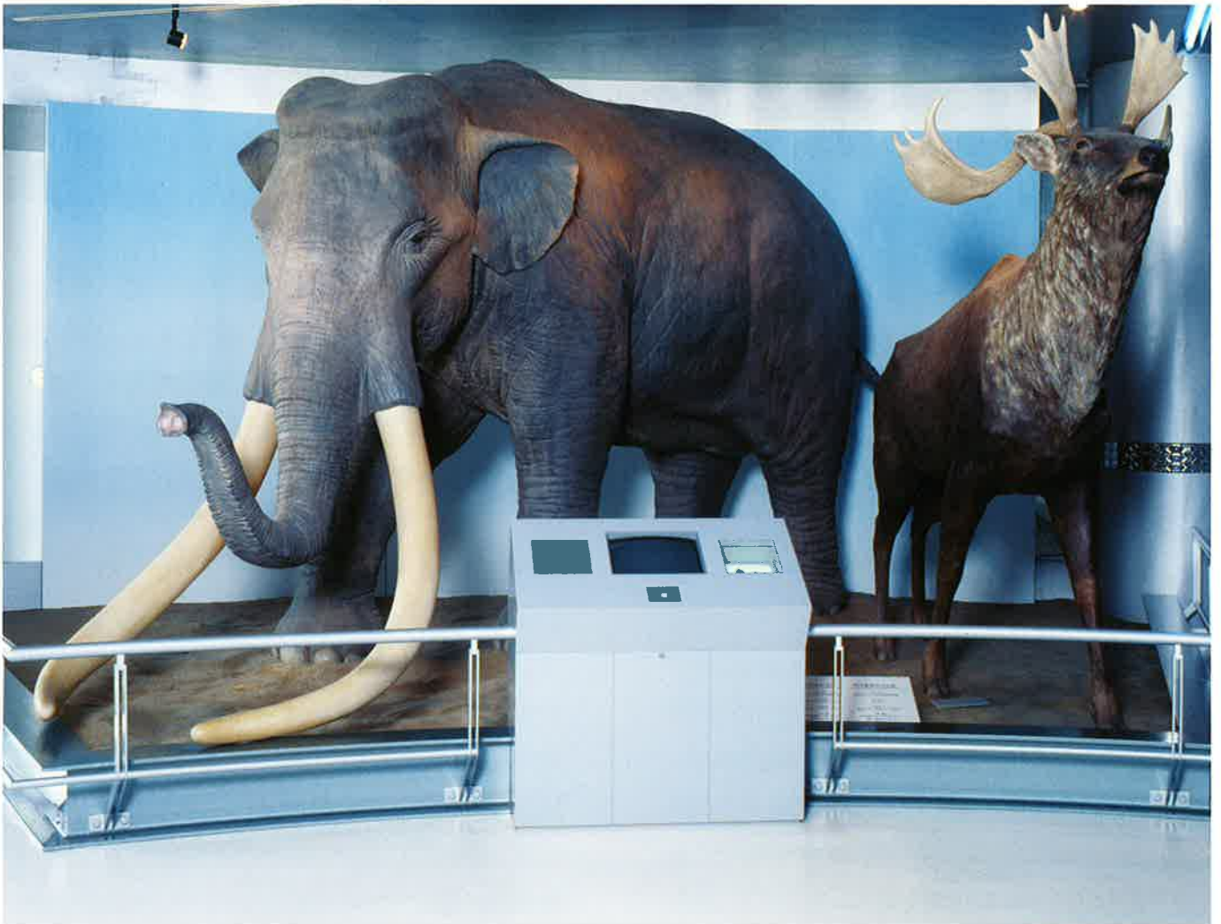
埋没林博物館のナウマンゾウとオオツノジカのレプリカ

約20万年前にアフリカで誕生した我々の祖先である現生人類(ホモ・サピエンス)がアジアに進出し、日本列島に渡ってきたのが約4万年前と考えられています。その頃の日本列島にはゾウの仲間である長鼻類やオオツノジカ、ヘラジカなどの大型動物が生息していました。富山平野でもナウマンゾウの化石が出土しており、狩猟生活をおくっていた後期旧石器時代(4万年前～1万5千年前)の人々にとって大型動物が繁殖する島々はこのうえもなく魅力的な大地に映ったことでしょう。長野県野尻湖のナウマンゾウやオオツノジカの化石出土地からは化石と一緒に旧石器人が使った石や骨で作った道具(石器、骨器)も出土しています。