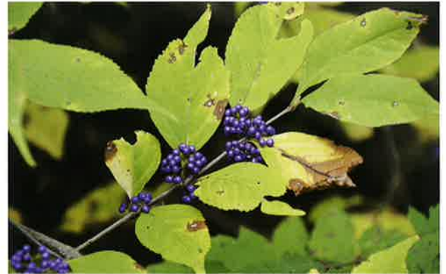
ムラサキシキブの果実

ムラサキシキブの果実の鮮やかな紫色は他の樹木にはちょっと見られない色で、鑑賞用に庭や公園などに