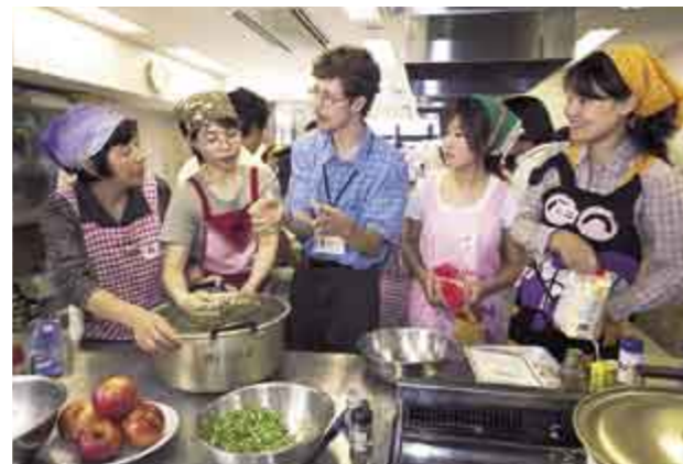
外国人による料理教室 Cooking class taught by foreigners