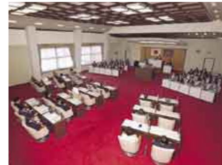
市議会 City Council