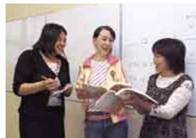
ボランティア日本語教室 Japanese class taught by volunteers

In any period of history, the ultimate goal of citizens and government has been to carry out town planning that enables each citizen to live a happy, affluent life. Uozu has many attractive resources for development, such as a beautiful natural setting, a rich history and culture, and an urban infrastructure. In addition to passing these resources down to the next generation, we aim to achieve "town development that enables citizens to live in constant health and happiness", all the while respecting people's individuality. Thus, our aim is for the citizens of Uozu to be comfortable spiritually as well as physically, and for citizens and government to play their respective roles and cooperate with one another in developing our city.