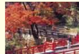
岡山県 井原市 Ibara, Okayama Pref.

チェンマイ市は、1996年に建都700年を迎えた古い王城の地で、タイ王国きっての伝統的な文化遺産に恵まれた美しい都市です。人口16万人のタイ王国第2の都市として、近年先端技術などの産業が盛んになっています。魚津市とは1989年8月に友好親善都市の盟約を結びました。