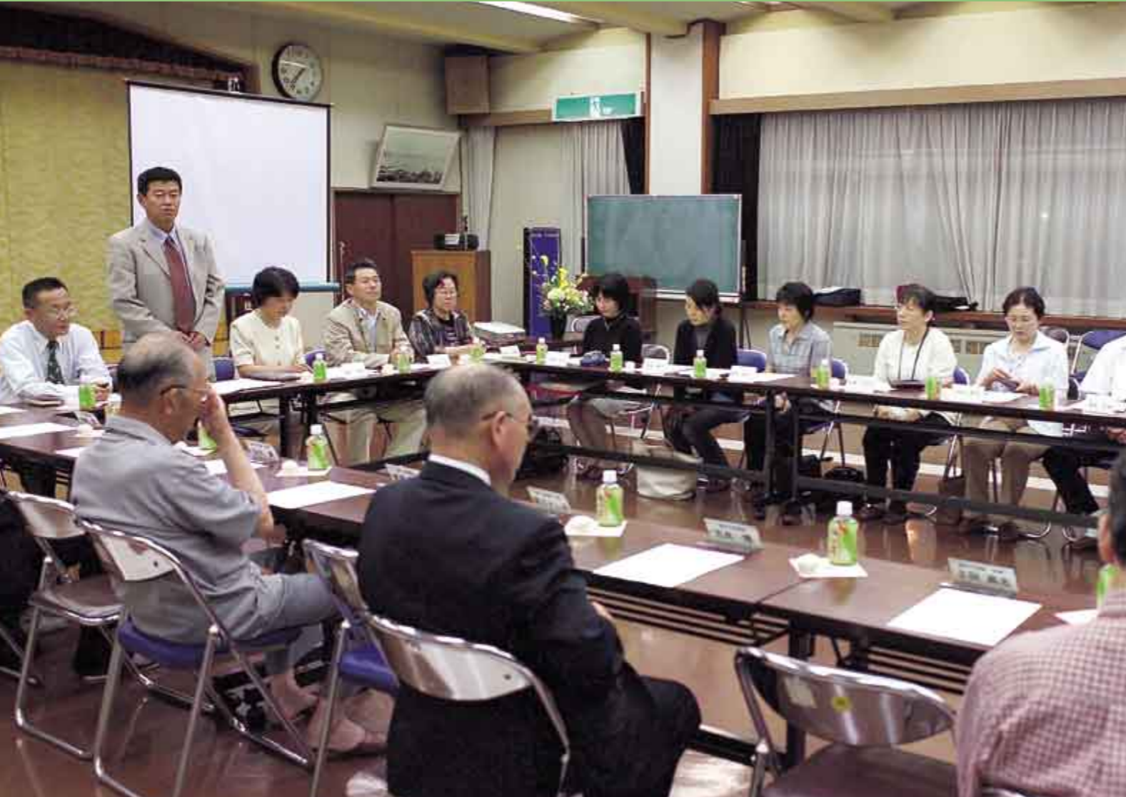
市民による男女共同参画についての集い Citizens' meeting about gender equality