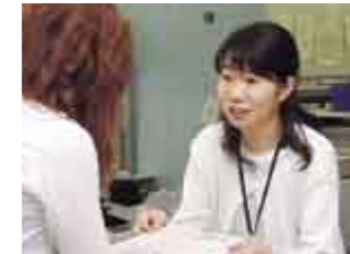
窓口サービス Serving a visitor

いつの時代においても、市民と行政がめざしてきた究極の目標は、市民一人ひとりが幸せで豊かな暮らしを実現できるまちづくりです。魚津市には、自然、歴史、文化、都市基盤などの魅力あるまちづくりの資源が数多くあり、この資源を次世代に継承するとともに、個人の人間性を尊重しながら、人々の心にゆとり・うるおい・やすらぎを与える「市民が元気で幸せに住み続けるまちづくり」を目指して、市民と行政が、それぞれの責任と役割を果たし、互いに連携・協力してまちづくりを行っています。