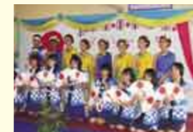
タイ王国 チェンマイ市 Chiang Mai, Thailand

チェンマイ市は、1996年に建都700年を迎えた古い王城の地で、タイ王国きっての伝統的な文化遺産に恵まれた美しい都市です。人口16万人のタイ王国第2の都市として、近年先端技術などの産業が盛んになっています。魚津市とは1989年8月に友好親善都市の盟約を結びました。