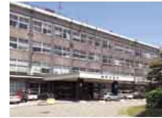
市庁舎 City Hall