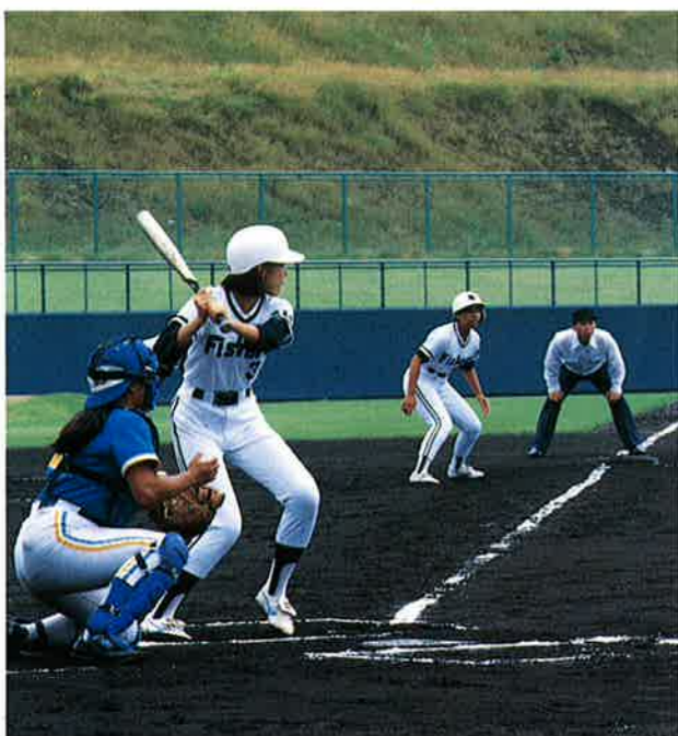
●全国大学女子軟式野球大会