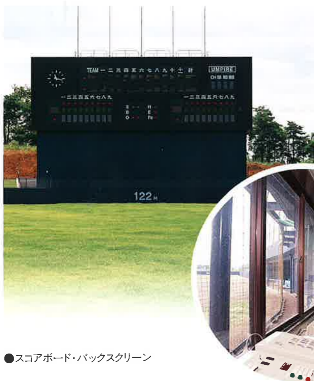
●スコアボード・バックスクリーン