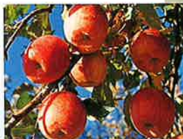
りんご園・ぶどう園