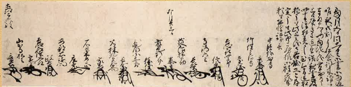
魚津在城衆十二名連署書状(天正十年) 山形大学附属図書館所蔵 織田方の武将達に包囲され、攻撃を受けていた魚津城において、守備を固める中条景泰ら12名の城将たちが、直江兼統に宛てて窮状を報告し、救援を要請した書状。