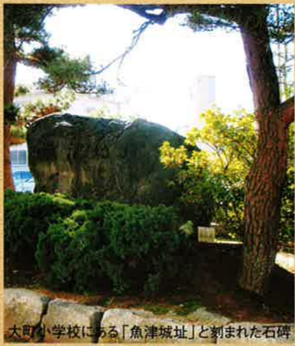
大町小学校にある「魚津城址」と刻まれた石碑

上杉謙信の死後、家督相継争い「御館の乱」の長期化により、越後国(新潟県)の勢力が衰えはじめた。越中国(富山県)への侵攻を目指す織田信長は、その機を逃さず、天正九年(一五八二)家臣の佐々成政を入国させる。越中の西部域をほぼ制圧し、上杉方は徐々に東部へと追いやられていった。魚津城や松倉城は、上杉方にとって、越中進出の拠点であり、越後防衛の拠点でもあった。謙信の後継者となった上杉景勝は、この二つの城を織田方と対峙する防備の要として重要視していた。