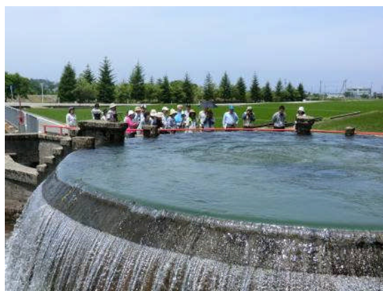
「さすが日本一美しいといわれるだけのことはある」とみなさん納得の様子。 東山円筒分水槽