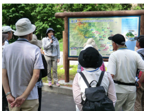
魚津の水循環について解説。 本日のツアー、スタートです。