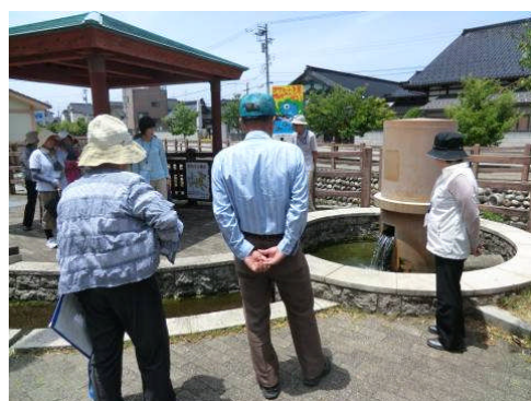
てんこ水の歴史など学びました。 餌指公園にて