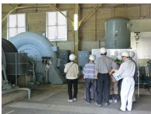
発電所の中では、水車と発電機の大きさと音に圧倒されました。

北陸電力魚津支社電力部の社員の方から発電所の内部を含めた見学案内とくわしい解説をしていただきました。