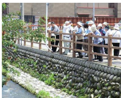
鴨川に見られるてんこ水について説明。