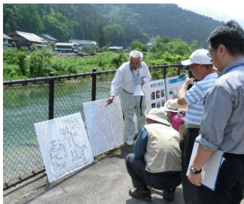
手作りの説明パネルに熱心に見入る参加者のみなさん。 黒谷頭首工

各施設の説明のほか、農業用水の歴史や川の水の流れ、市民生活に関わる役割などを魚津市土地改良区の方に説明していただきました。