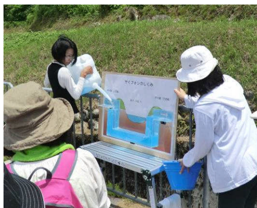
手作りの模型を使ってわかりやすく解説。 東山円筒分水槽