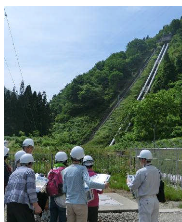
落差約 120mの水圧鉄管を流れ落ちる水の力を利用して発電。