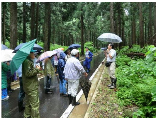
雨の中、まさに水循環を体感できました。