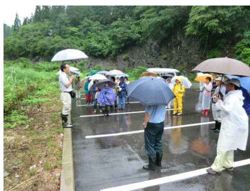
魚津の水循環と森が果たす役割 について解説