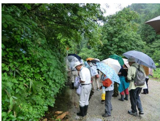
モリアオガエルのオタマジャクシにみ なさん興味深々でした。