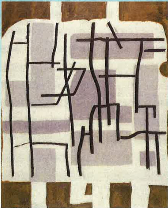
村井正誠《サハラの男たち》1983年