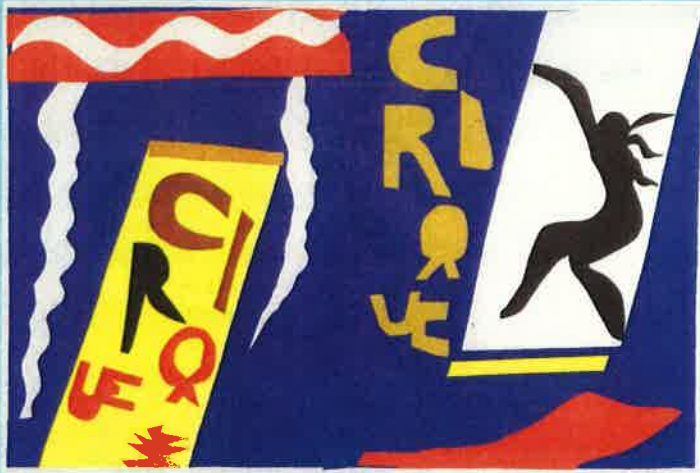
アンリ・マティス 版画集「JAZZ」(20点組)より《サーカス》1947年