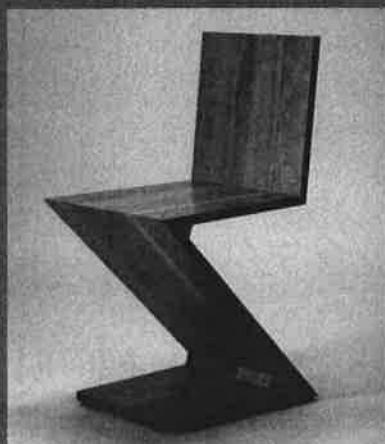
ヘリット・トマス・リートフェルト 《ZIG-ZAG》1934年