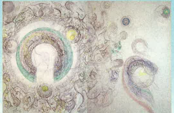
前田常作《人間誕生No.5》1963年