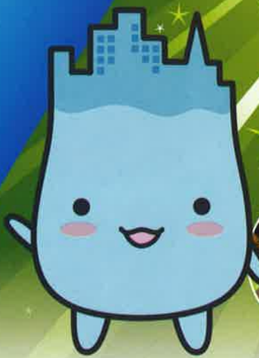
魚津市イメージキャラクター 「ミラたん」