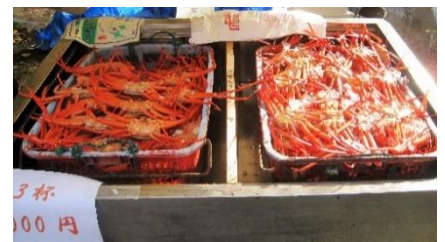
岩魚の塩焼き、クマ鍋等、山菜、地場産品、漬物、新鮮なカニ等の販売で賑わう