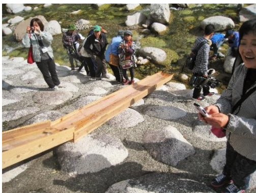
(杉の間伐材で利用した樋)