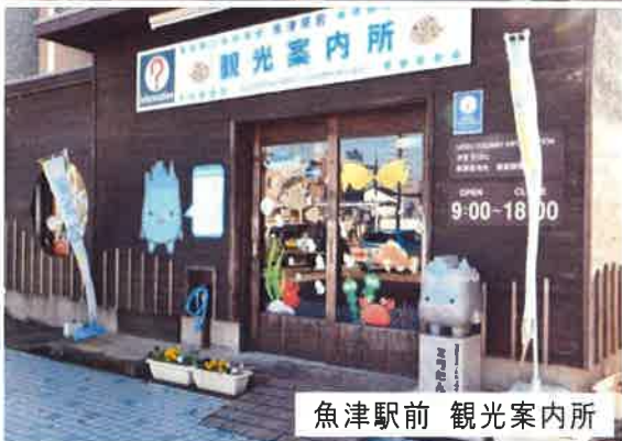
魚津駅前 観光案内所