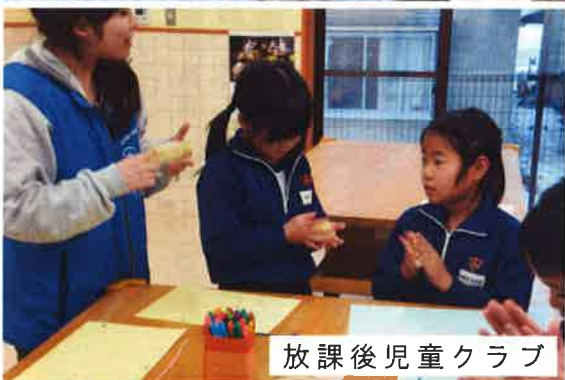
放課後児童クラブ