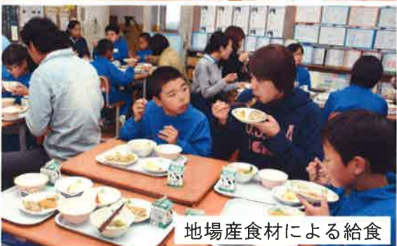
地場産食材による給食