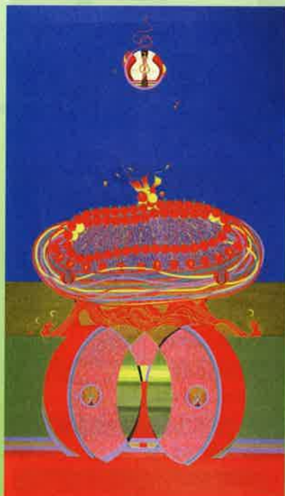
野上祇麿 《山車》 1983年