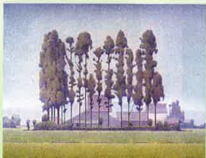
山田嘉彦 《砺波》 1981年