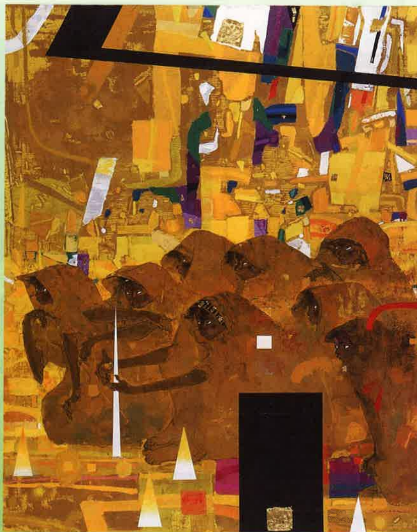
林清納 《インドの女 鎮魂歌A》 2001年