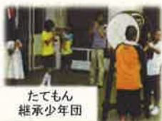
たてもん継承少年団