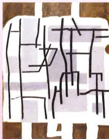
村井正誠「サハラの男たち」1983年