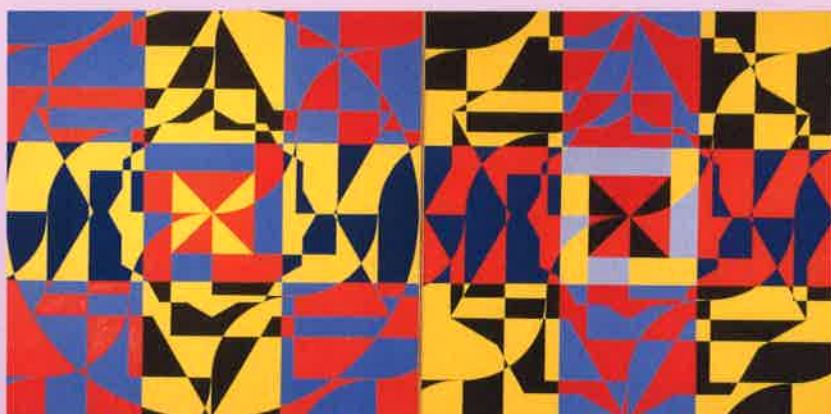
オノサトシノブ「相似'80」1980年