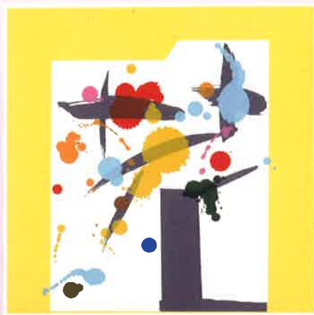
田中一光「作品一花」1979年