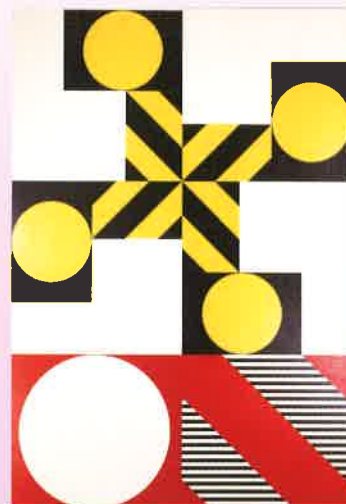
菅井汲「ヴァリアシオンーB'78」1978年