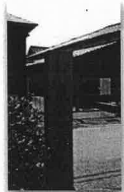
米騒動発祥の地標柱