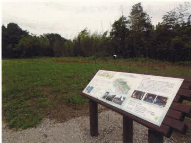
学びの森交流館裏手にある植樹会場と解説板