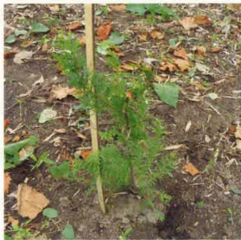
昨年植樹したスギ