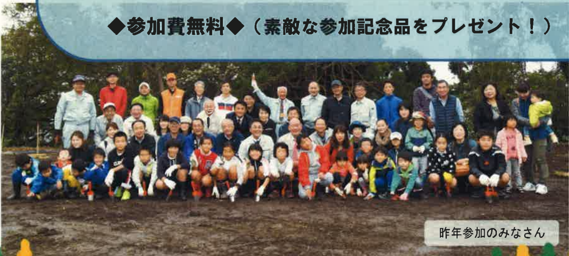
昨年参加のみなさん