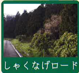
しゃくなげロード