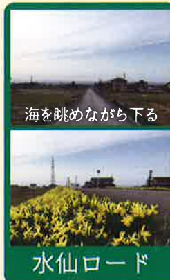
海を眺めながら下る