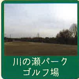
川の瀬パークゴルフ場