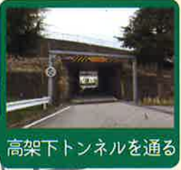
高架下トンネルを通る