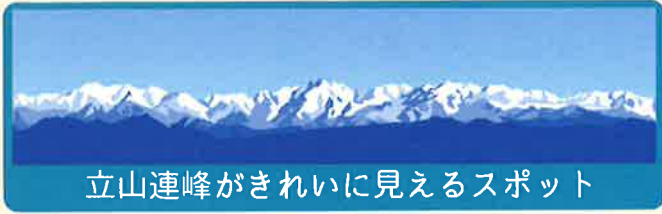
立山連峰がきれいに見えるスポット