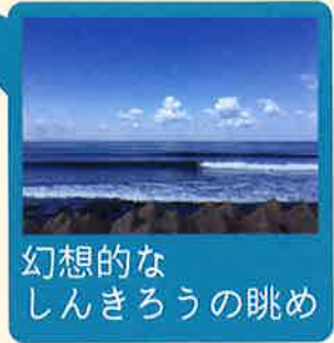
幻想的なしんきろうの眺め

幻想的なしんきろうの眺め 富山県が紹介している、道路から見える美しい景色の中の1つです。