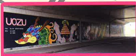
高速道路下の壁画