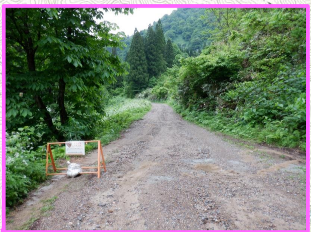
市道東又線市道東又線(東又谷・片貝山荘等) 全線開通しました。 落石に注意して通行してください。