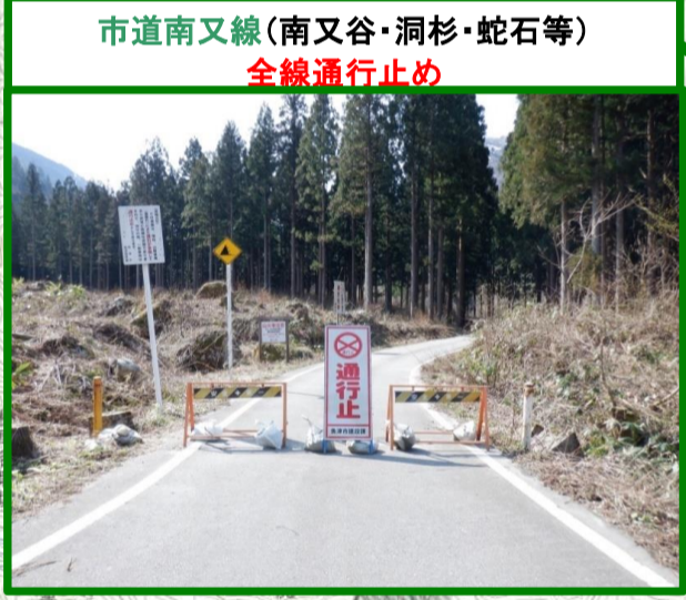
市道南又線(南又谷・洞杉・蛇石等) 全線通行止め