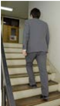
▶日常生活の中で「歩く」 時間を増やしましょう

自分のかかりつけ医・薬局 を決め、必要以上の重複受診 はやめましょう。また、時間 外受診や休日受診は医療費が 割高になります。やむを得な いとき以外は、通常の診察時 間内に受診しましょう。 そのほか、お薬手帳を活用 することで効率的に治療を進 めることができます。