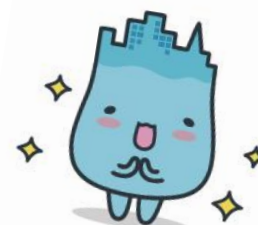
魚津市イメージキャラクター 「ミラたん」