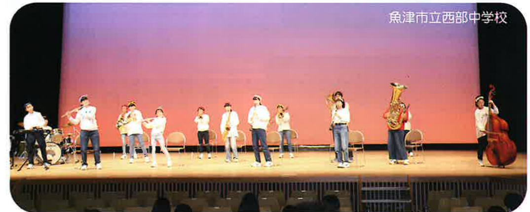
魚津市立西部中学校