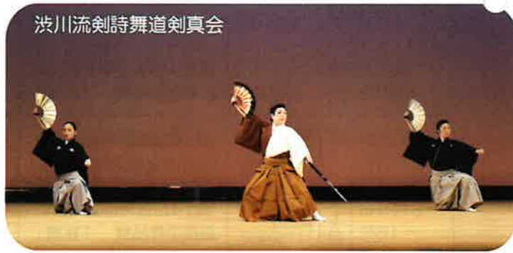
渋川流剣詩舞道剣真会