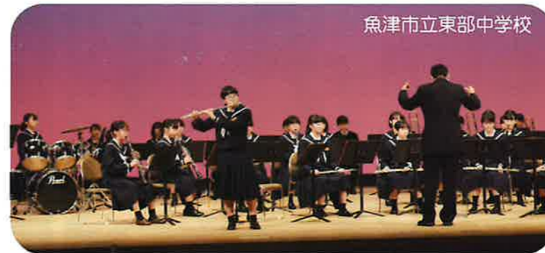
魚津市立東部中学校