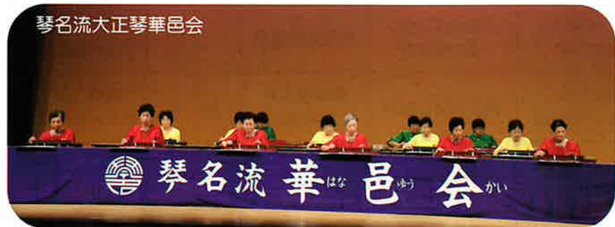
琴名流大正琴華邑会