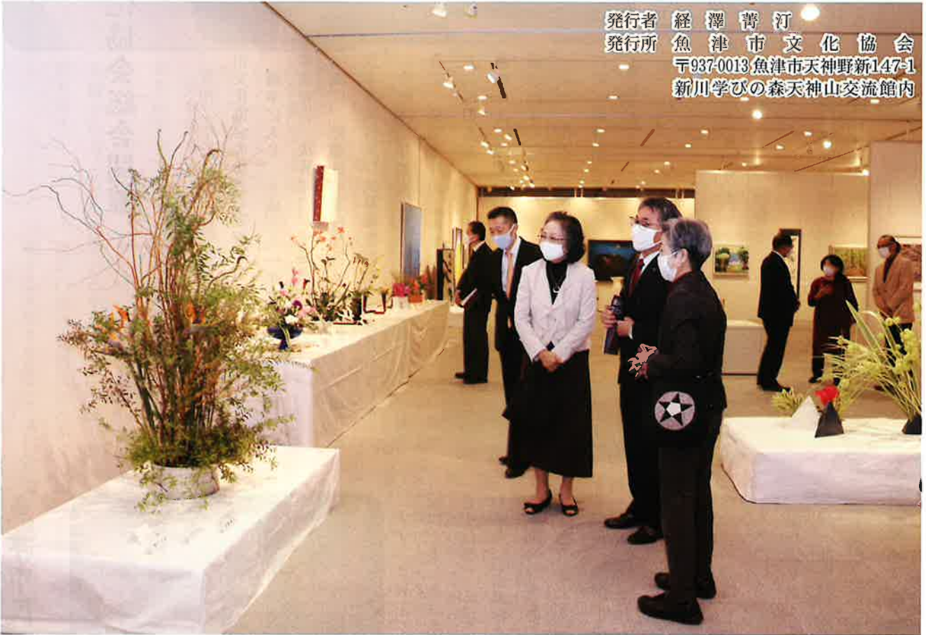
魚津市民文化祭（展示会場にて）

発行者 経澤青汀 発行所 魚津市文化協会 〒937-0013 魚津市天神野新147-1 新川学びの森天神山交流館内