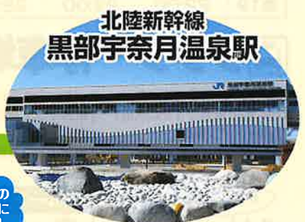
北陸新幹線 黒部宇奈月温泉駅