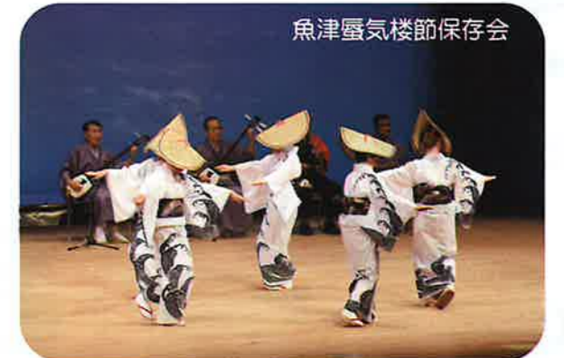
魚津蜃気楼節保存会