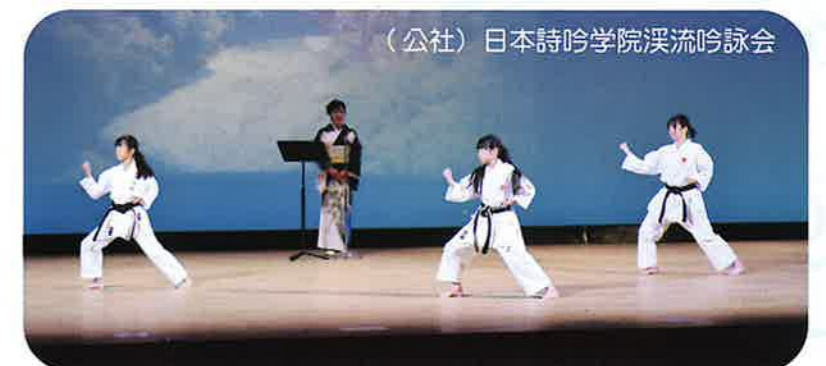
(公社) 日本詩吟学院溪流吟詠会