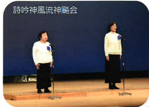
詩吟神風流神髓会