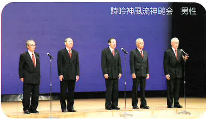
詩吟神風流神髓会 男性