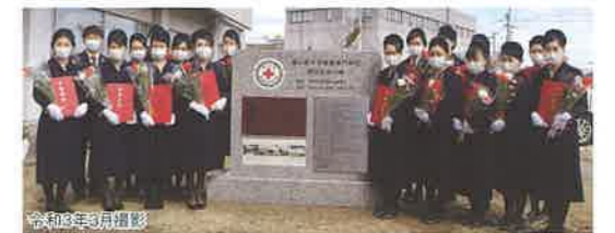
閉校記念の碑の前で最後の卒業生

富山赤十字看護専門学校は令和3年3月に閉校しました。明治28年の創立以来、3,554名の卒業生を輩出しました。これまで長きにわたり、教育活動にご理解ご支援賜りました皆様方に厚くお礼申し上げます。