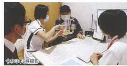
患者支援センターでの入院前療養指導・相談