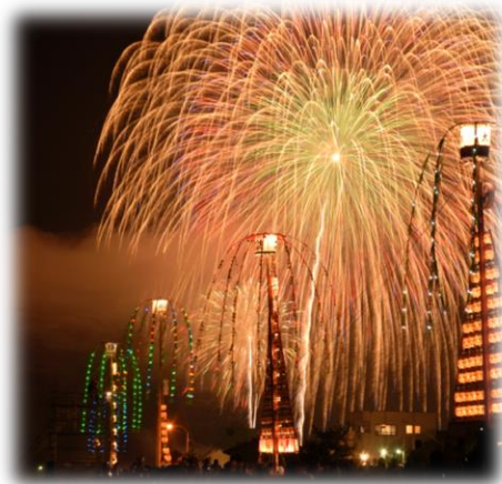
じゃんといこい魚津祭り (8月はじめの金土日)