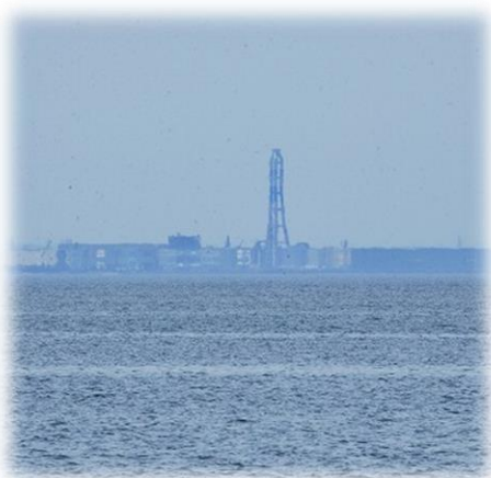
しんきろう(春に多く見られる 幻想的な風景です)