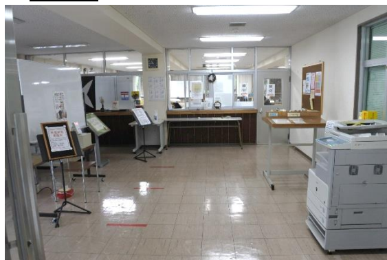
エントランスホール