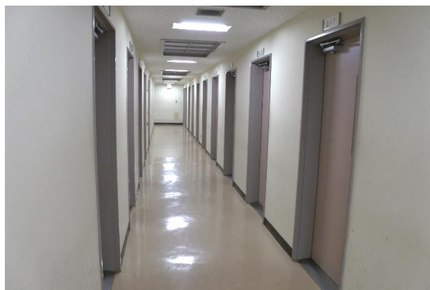
廊下の左右に保管庫