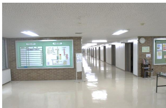
エントランスから1階廊下