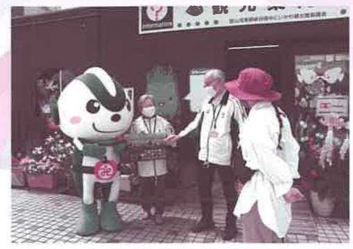
うおっしゃくくんもボランティアを体験！

コロナ感染対策のため楽しみだったお祭りや行事が中止になって残念な気持ちになります。でも、観光ボランティアの皆さんは大好きな魚津を元気にするために活動を続けておられます。今回は「魚津観光ボランティアじゃんとこい」の皆さんの活動を通じて、ボランティア活動のあれこれについて紹介します。