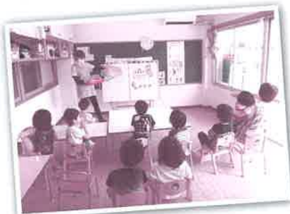
▲つくし学園の様子

地域において必要な人が成年後見制度を利用できるよう、地域における相談窓口を整備し、中核機関に求められる4つの機能 (広報・相談・制度利用促進・後見人支援) が果たせるよう体制を整えます。