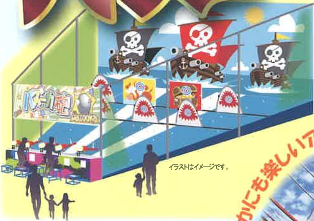
イラストはイメージです。