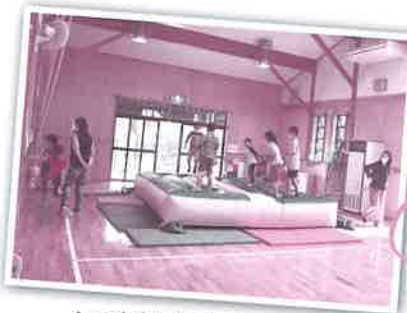
▲つばめ児童センターみなSUNデーの様子