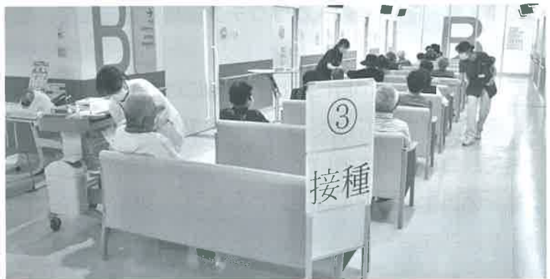
病院でのワクチン接種(5月29日撮影)

当初は平日午後のみと考えていたのですが、希望者が多いことや付き添いの方の便も考えて土曜日にも行うことにしました。最盛期には週に490人に接種予定です。6月になれば市の集団接種も始まります。市内医院などの接種も本格的になると思いますので、ワクチン普及は一層早まるでしょう。ろうさい病院も全力を挙げて取り組んでいます。