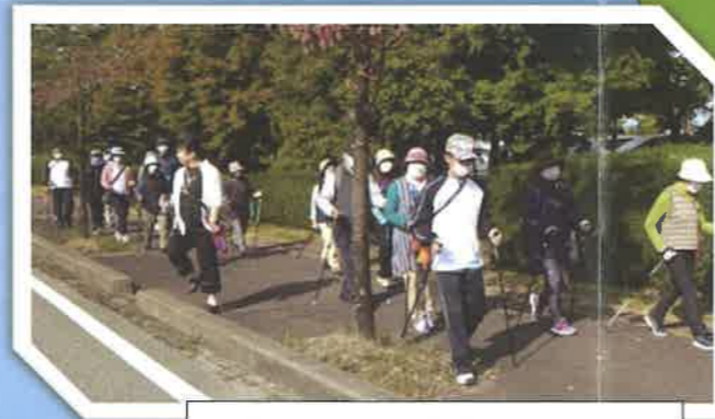
出前講習 下中島地区 『ノルディックウォーキング』