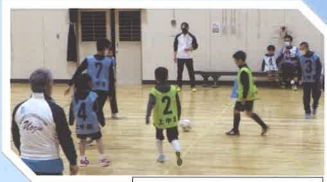
出前講習 上中島地区 『ウォーキングサッカー』