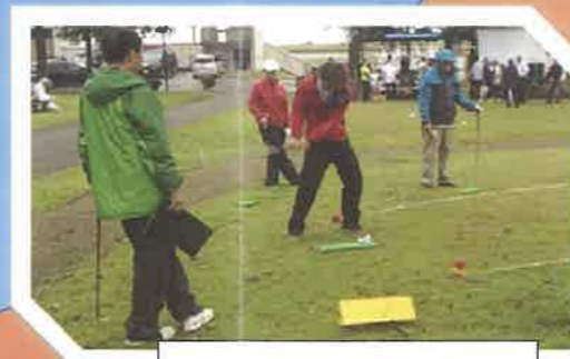
ターゲットパードゴルフ