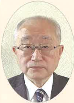
魚津市教育委員会 教育長 山瀬 敬

スポーツは、健康維持、体力の増進、ストレスの発散など、生活をより豊かにしてくれます。