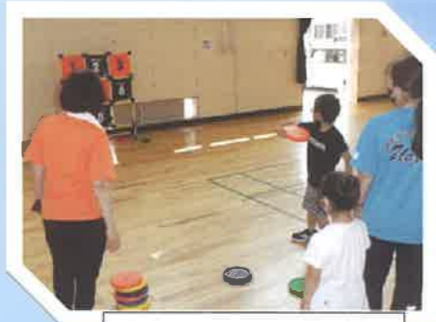
UO!SPO in 上中島