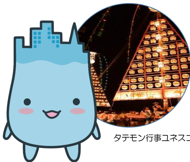
タテモン行事ユネスコ無形文化遺産