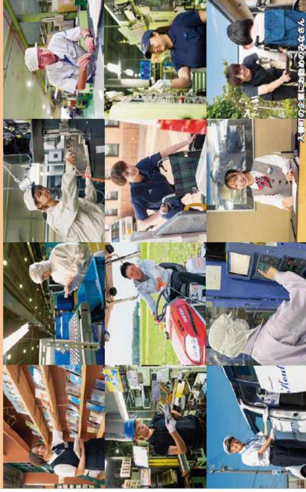
入善町の企業にお勤めのみなさん

ご来場される皆様へ ●新型コロナウイルス感染予防のため、マスクを着用してご来場ください。 ●体調がすぐれない方のご来場はお控えください。 ※新型コロナウイルスの感染状況によっては、急遽、中止とする場合がありますので、ご了承ください。