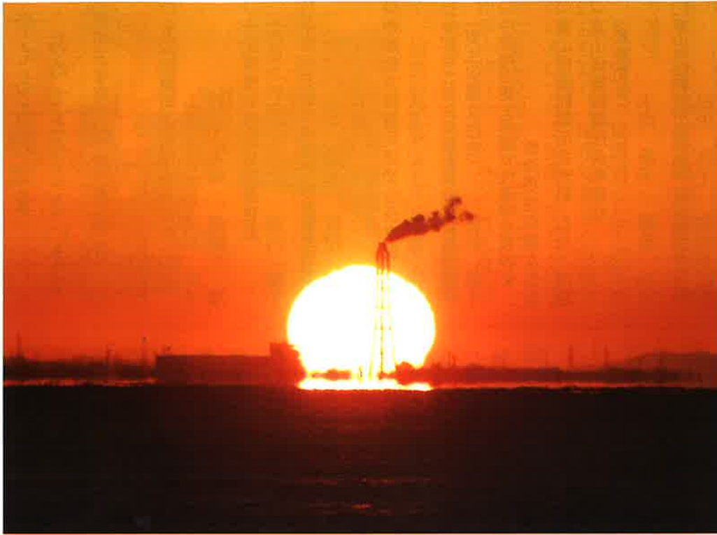
富山湾の夕日と蜃気楼