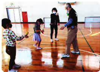
上野方地区「けん玉を楽しむ会」 一人でも家族でも楽しめるけん玉をけん玉協会の方に教えてもらいました。大皿や小皿に乗せられるようになり大喜びしました。

コロナ禍で活動は停止となりましたが、そんな中、役員自身がかへへの理解を深め、新会員のお誘いの資料にもと過去の総会資料を基に年度別実践活動を『あゆみ』と題してまとめることができました。「会」への関心を持てるよう検討を重ね何とか冊子にできました。本会の発足当初は「更生保護婦人会」の名称で、戦後、親を失った子供達を「ほっとけない」との思いで婦人会有志が発足したとのことですが、諸先輩の活動実践からも中学校が荒れた時代は地域ご