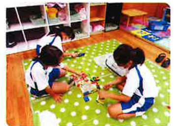
西布施地区放課後児童クラブ 放課後の時間を宿題や好きな遊びに集中し、安心して過ごせるように環境を整えています。