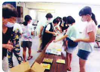
松倉地区「タイルクラフト教室 (オリジナル置時計作り)」 子どもたちの感性と手際よさに感心しきり！自分だけのデザイン時計に大満足でした。