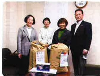
毎年、養得園（刑を終えた方が自立できるまで生活する施設）におふくろの味を提供する「食事作り」がコロナ禍で中止となり、新米を寄贈しました。

とに「子育て支援」や「ミニ集会」が活発に開かれています。また、更生保護施設への支援、立ち直りのための支援活動などをされ、「ほっとけない」の心を垣間見ることができ、感動しました。社会事情の変化とともに益々人間関係の希薄化、孤立化が心配されています。私どもは社会の変化に対応し、関係機関とも連携しながら、温かく結び合う社会を目指し活動していきたいと思います。