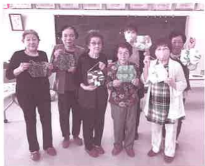
▲レター入れの創作教室