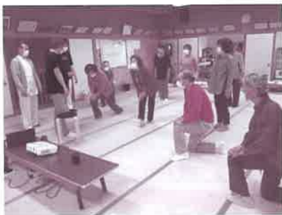
▲接骨師会さんによる転倒予防体操