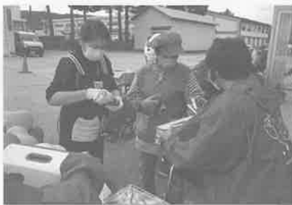
▲上野方軽トラ野菜市にて▶