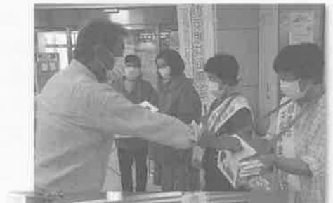
▲サンプラザ街頭募金にて