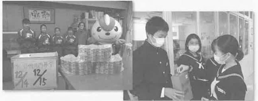
▲清流小学校、西部中学校の学校募金▲