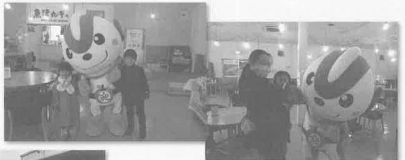
▲みらパークイベント会場にて▲