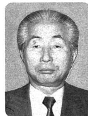
藍綬褒章 〈自動車運送事業功績〉