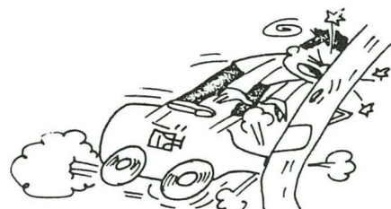
あのせゆき 酒が運転する車