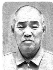
勲六等瑞宝章 〈郵便業務功労〉