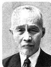
勲六等瑞宝章 〈郵便業務功労〉