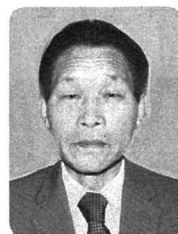
勲七等青色桐葉章 〈消防功労〉