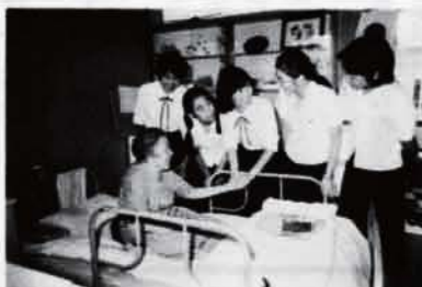
▲里祖父母心の縁結び