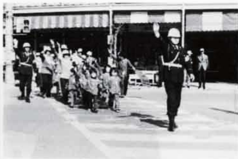
▲交通安全（横断歩道指導）

○運転する人は、ハンドルを持つ前に十分休むようにしてください。もし、運転中眠くなったときは、車を止めて休みましょう。