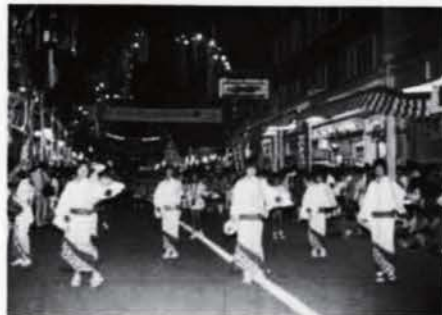
▲せり込み蝶六街流し

8月8日の車両通行禁止に伴い、地鉄バスでは定期バスを運行するため、臨時バス停留場を市民会館通りに設けられますからご利用ください。