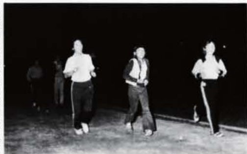
▶吉田グラウンドで夜間マラソン練習

なお市総合体育館裏の吉田グラウンドは夜九時近くまで夜間照明がしてあり誰でも自由に走れます。