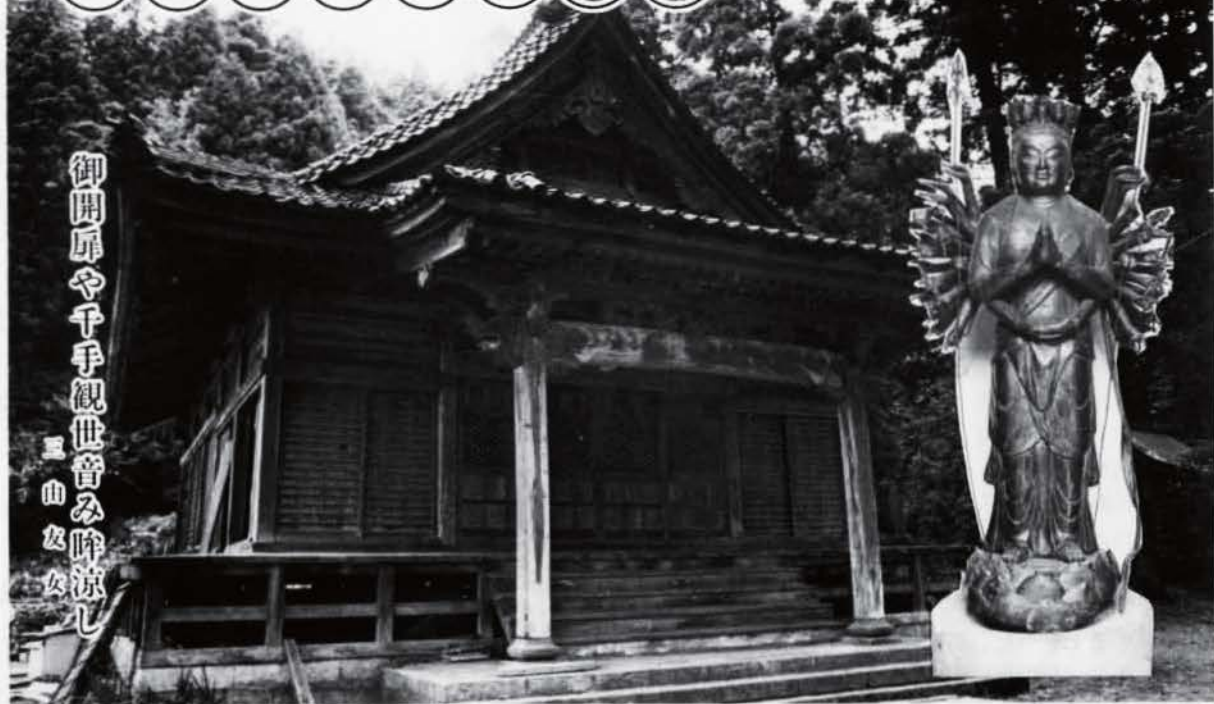
御開扉や千手観世音み降涼し 三山女