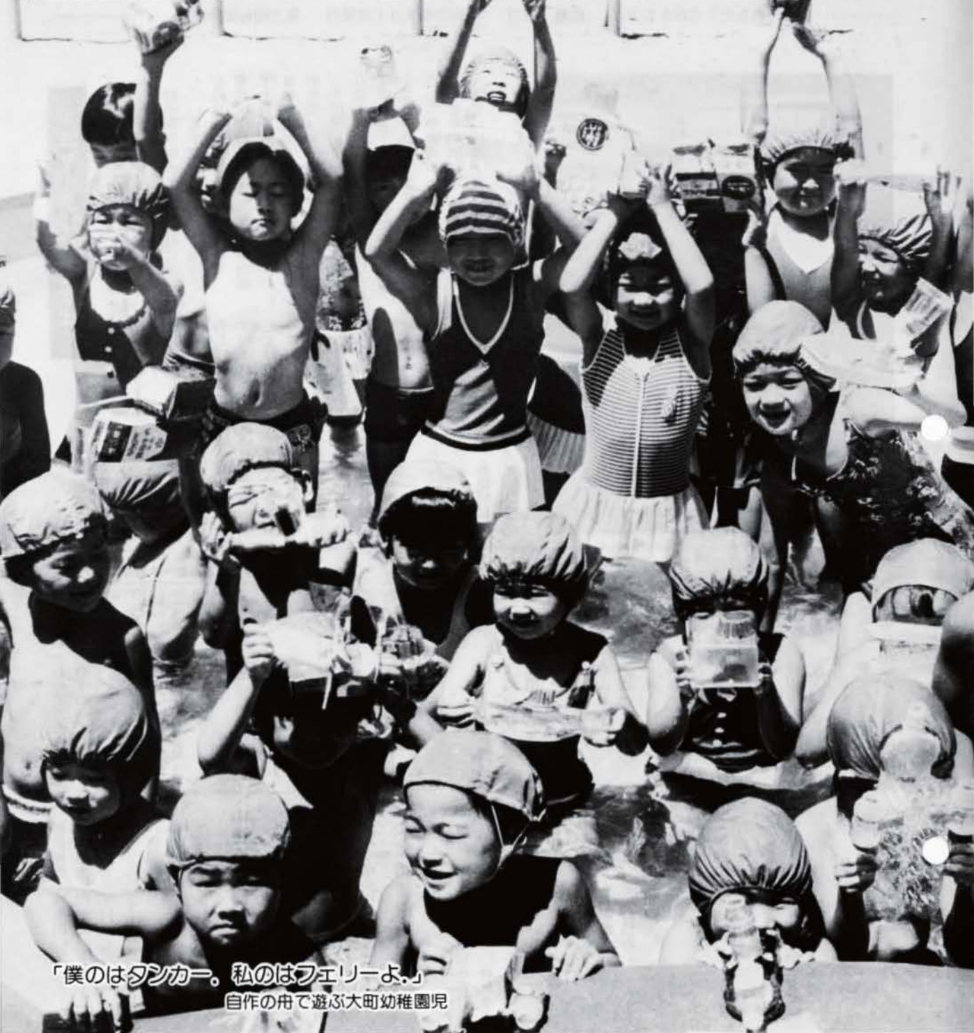
「僕のはタンカー。私のはフェリーよ。」 自作の舟で遊ぶ大町幼稚園児