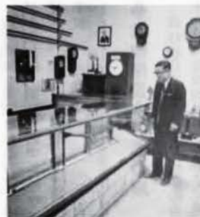
▲歴史民俗資料館展示室

歴史民俗資料館より かつての除隊記念のさかずきで不用のものがありましたら資料館へ御寄付願います。 連絡先 歴史民俗資料館 社会教育課 ☎31-7220 ☎22-2200 (内線三〇八)