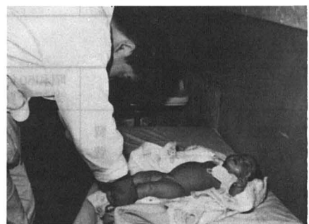
乳幼児のこ脱検診

■市債については、国の地方債計画の緊縮が本年度も堅持されるの、これらを勘案しながら計上され、その他の収入については、前年度実績および確実に見込み得る