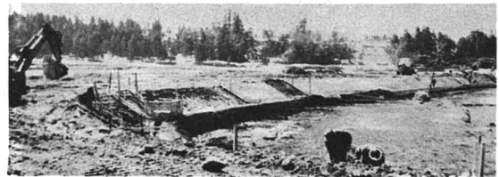
▲建設が進むスーパー農道(石垣地内)