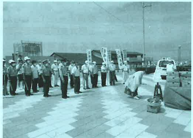
夏の交通安全県民運動 「大・根・絶」作戦 (R4.7.14)