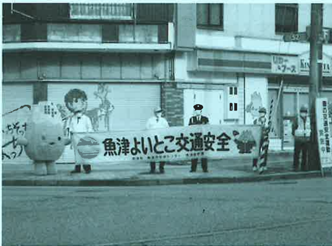
春の全国交通安全運動 ひとなみ作戦 (R4.4.6)