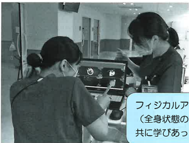
フィジカルアセスメント (全身状態の把握)を 共に学びあっています。

ハイケアユニット(High Care Unit:HCU)は重症、高度な医療を必要とする患者さんが入られます。循環動態をコントロールする精密な薬剤の使用や人工呼吸器管理、病室内での透析など各診療科でも密度の高い観察と看護、医療を必要とされる患者さんを看ています。