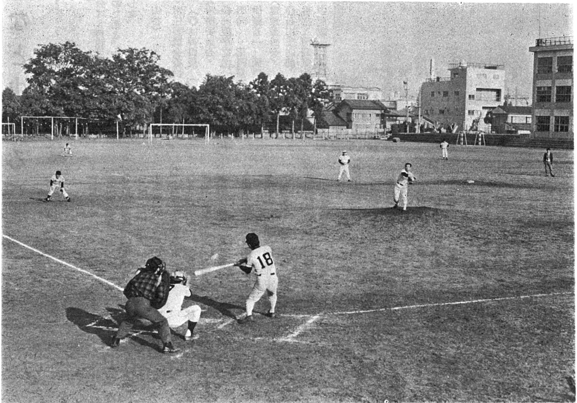
(として保存しましょう)