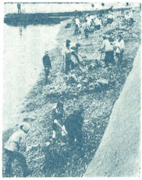
写真=大町海岸をきれいにと町内総ぐるみの清掃作業

私たちの住む町を汚さないできれいに保ち、生活環境をより美しくするため、ことしも6月1日から7月31日まで「川をきれいにする運動」がはじまります。