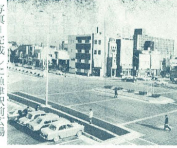
完成した魚津駅前広場