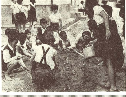
花と緑で美しくしよう

魚津市を花と緑で美しくする運動が展開されています。5月中旬に花と緑で美しくする運動推進協議会が設立されましたが、同協議会では、次のようなことを企画し、実践につとめることにしております。