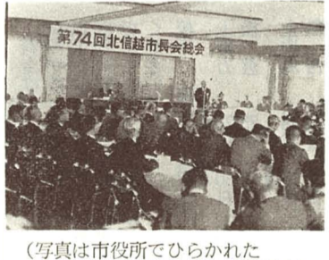
(写真は市役所で行われた北信越市長会総会)

あゆの解禁は、あゆが解禁されています。あゆ解禁は、あゆが解禁されています。あゆ解禁は、あゆが解禁されています。