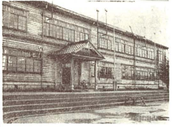
写真は改築される上野方小学校の校舎

上野方小学校の校舎がこんど鉄筋コンクリート二階建てに改築されることになり、31日に起工式が行なわれました。