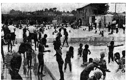
(写真) 毎日ぎわっている同プール

住吉小学校にこのほどプールが完成し、7月12日、プール開きが行なわれました。このプールは、吉田工業株式会社からの寄付金によってつくられたもので、長さ二十五メートル、幅十三メートル、六コースのものと、低学年用の縦十メートル、横八メートルの二つがあります。付属設備としてシャワー、足洗い場、更衣室、監視席、浄化装置室などがあり、総工事費八百二十万円。児童たちは、このりっぱなプールの贈り物に大喜び、暑い毎日を水遊びで楽しんでいます。