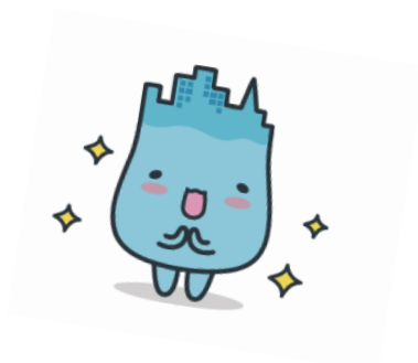
魚津市イメージキャラクター