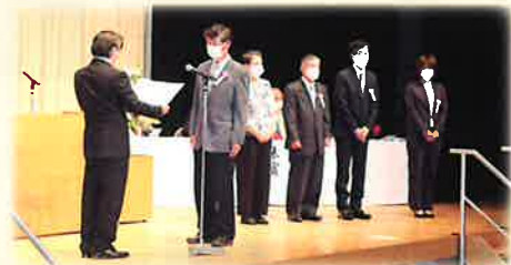
▲第71回 魚津市社会福祉大会 表彰式の様子