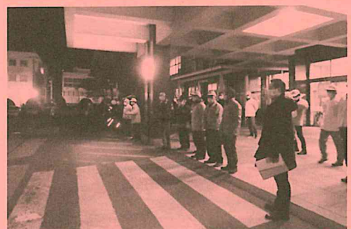
昨年の防犯パトロール出発式の様子

皆さまが来年も明るく、穏やかに過ごすことができますよう、防犯協会も各種行事を活発に行っていきますので、ご協力をお願いいたします。(担当：I)