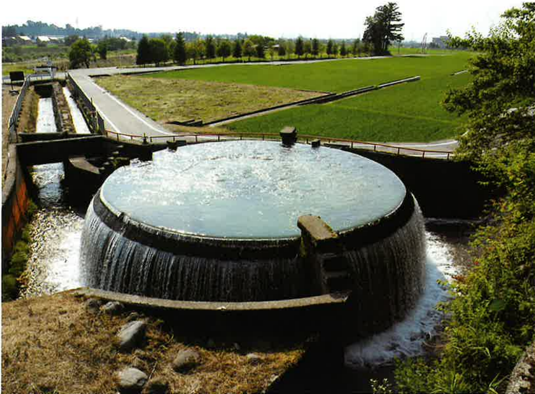
東山円筒分水漕